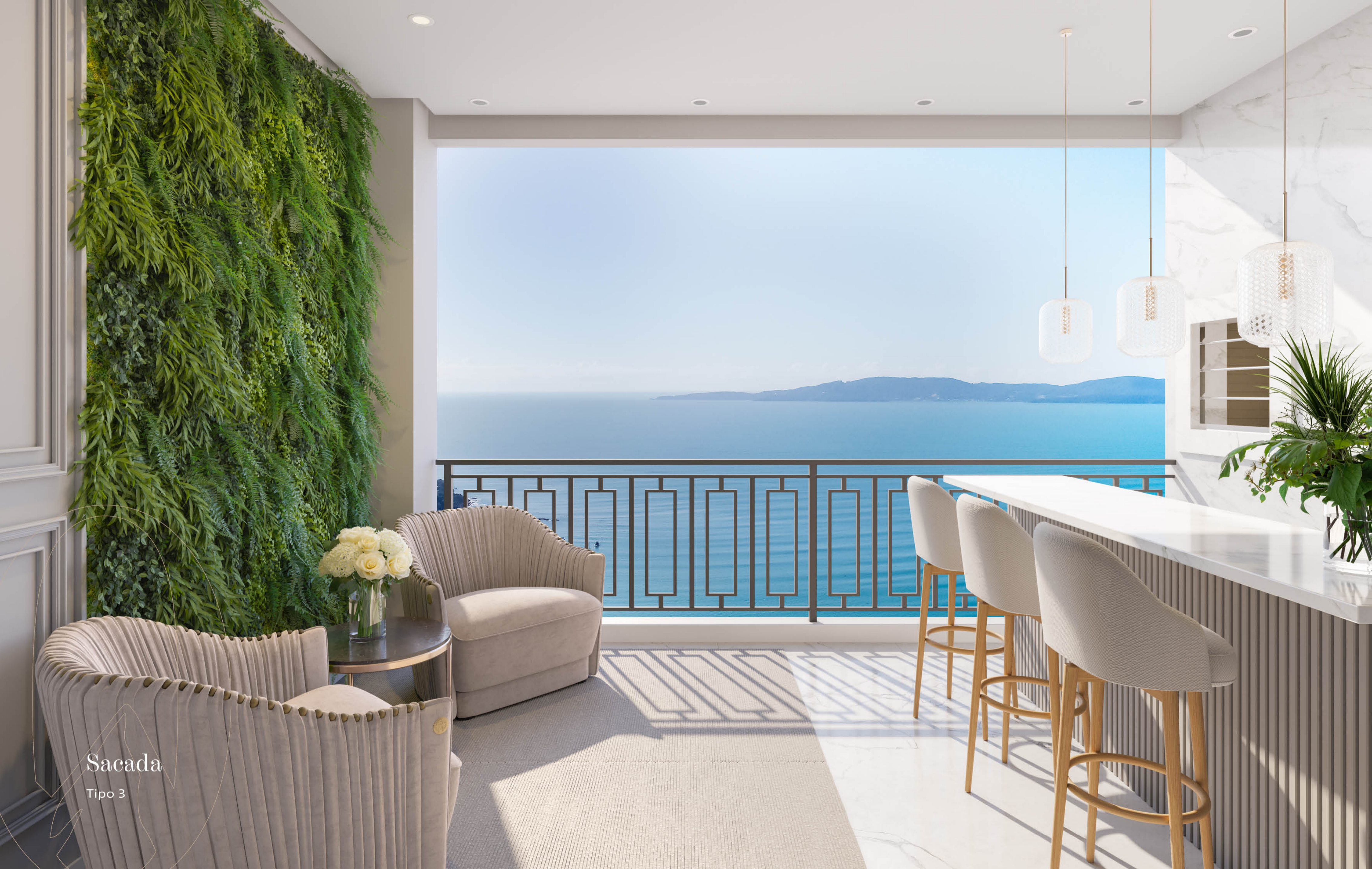
Sacada Tipo 3