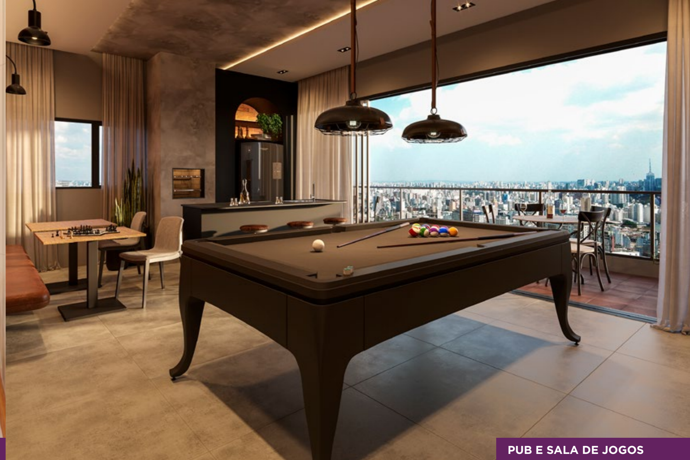
PUB E SALA DE JOGOS