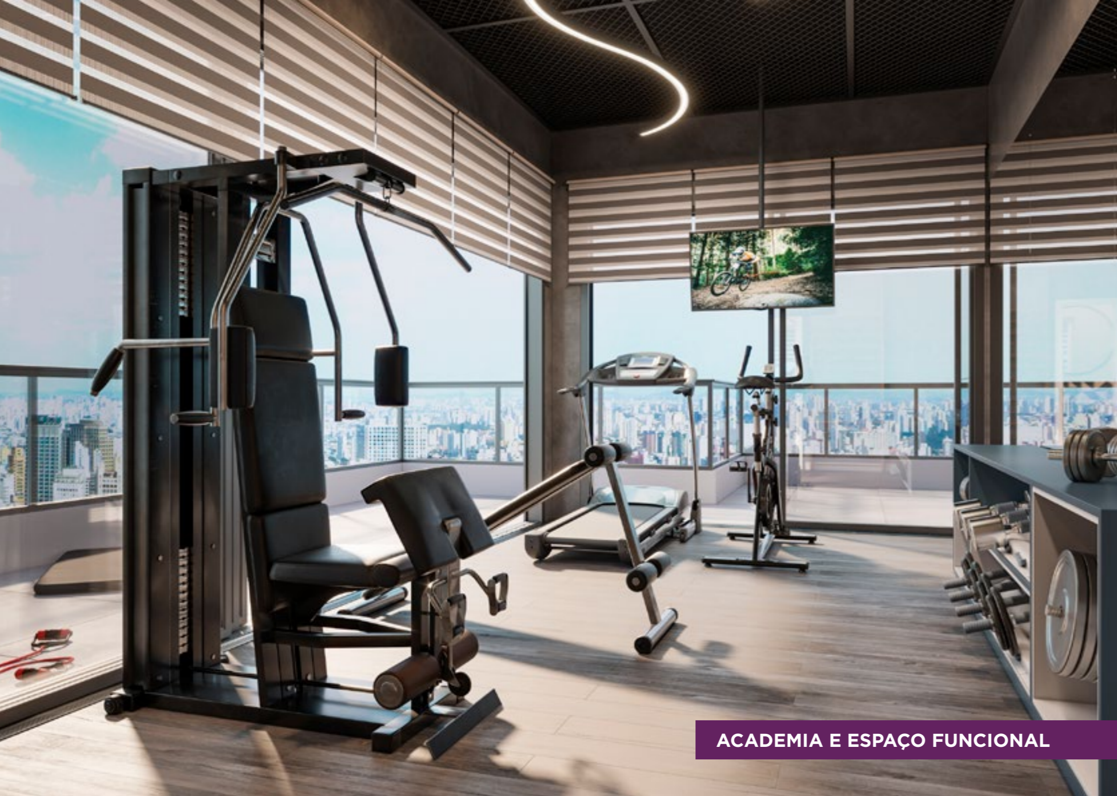
ACADEMIA E ESPAÇO FUNCIONAL